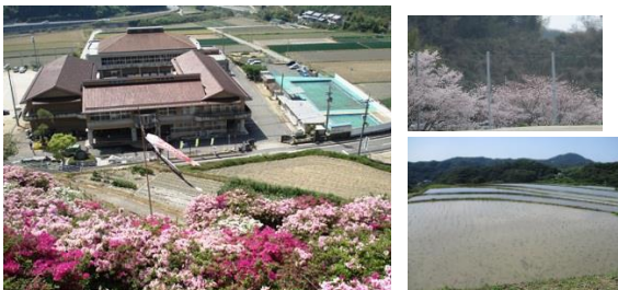
ツツジが満開の貫之山から見た立岩小学校